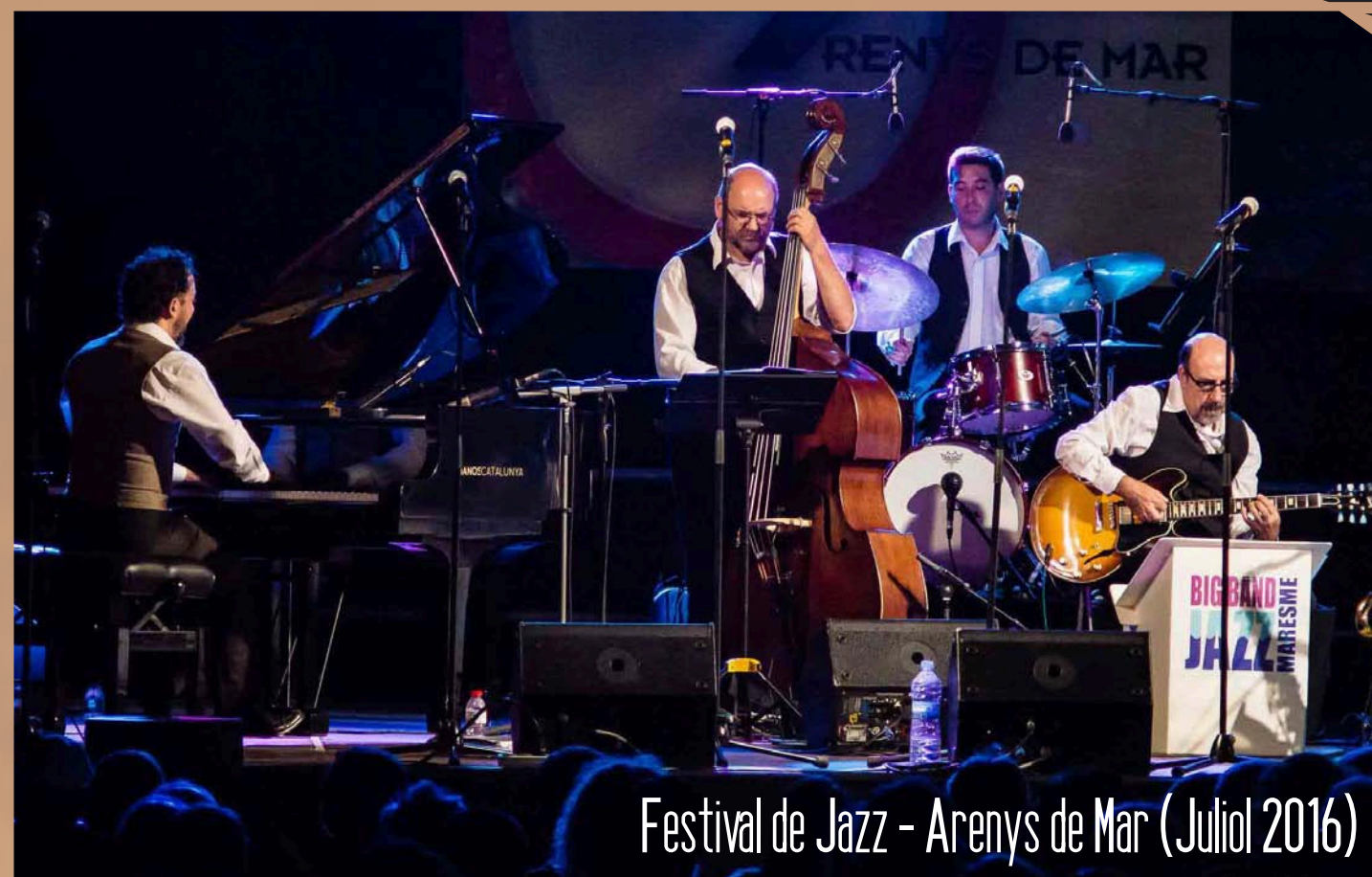
Festival de Jazz - Arenys de Mar (Juliol 2016)