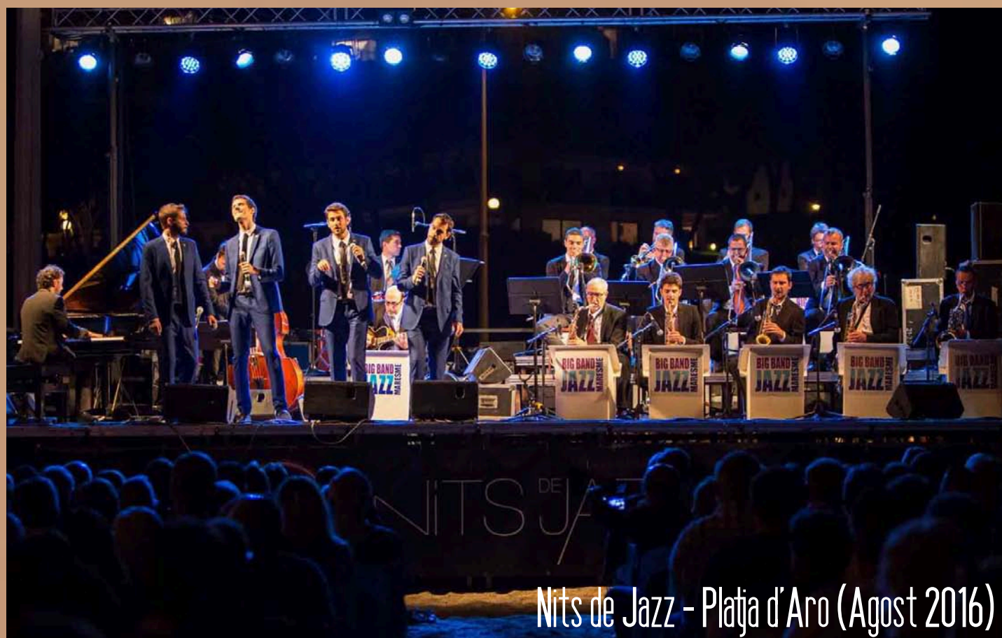
Nits de Jazz - Platja d'Aro (Agost 2016)