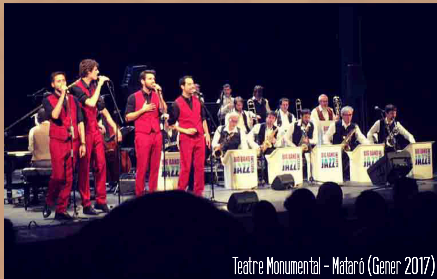
Teatre Monumental - Mataró (Gener 2017)