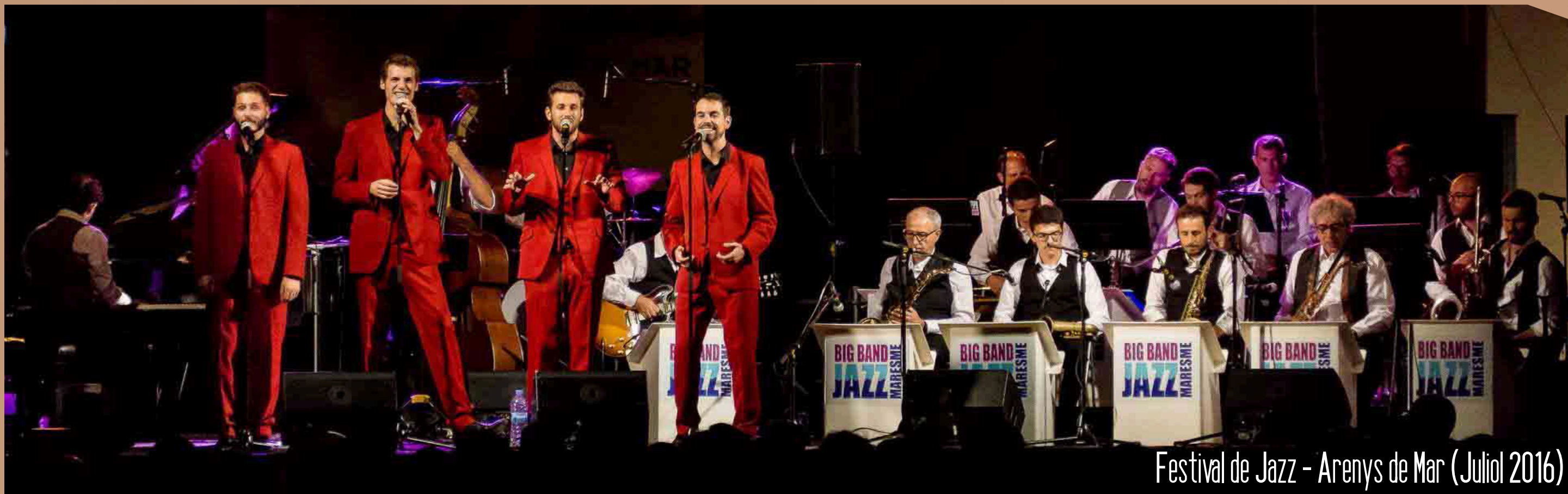
Festival de Jazz - Arenys de Mar (Juliol 2016)