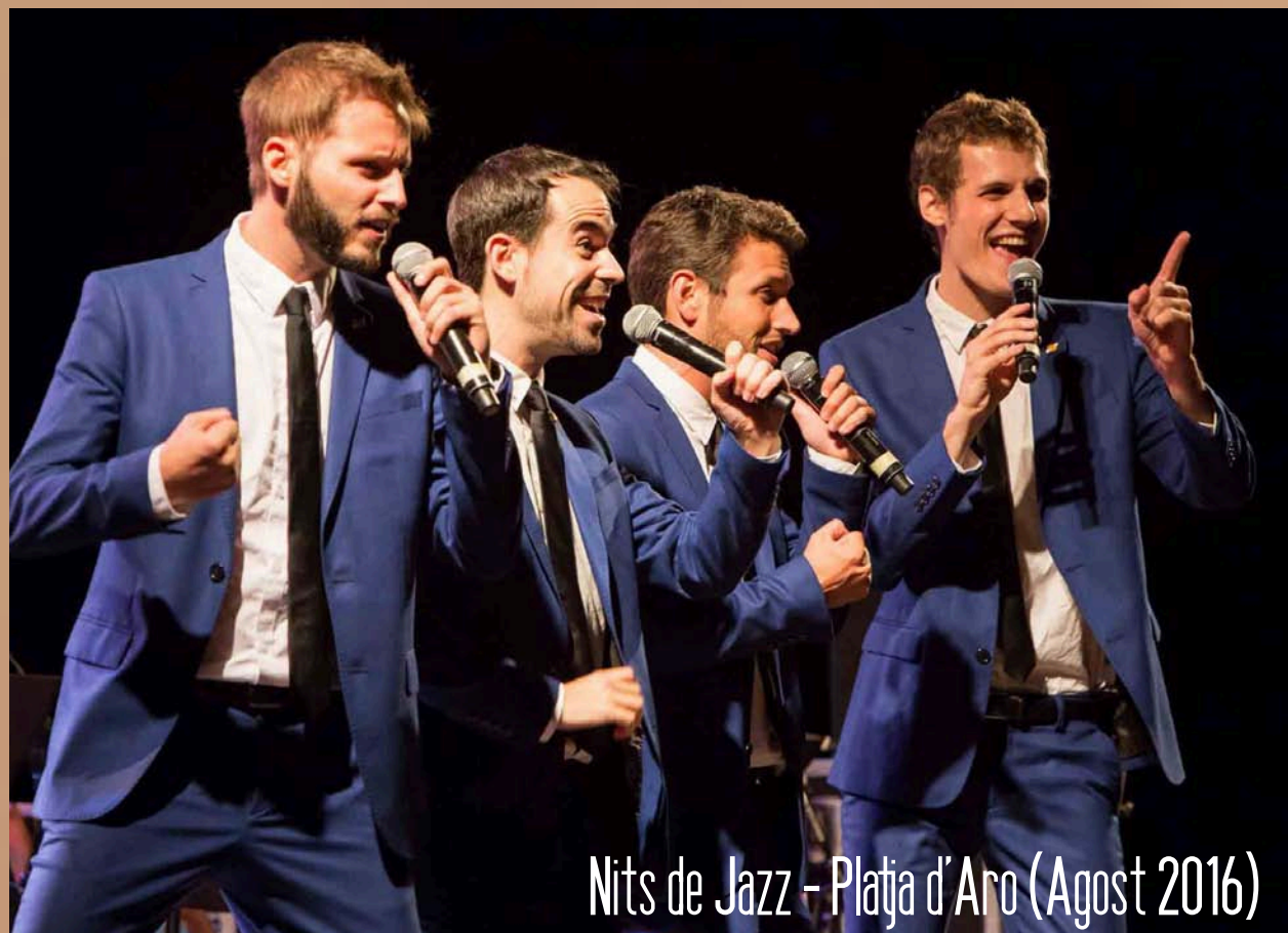
Nits de Jazz - Platja d'Aro (Agost 2016)