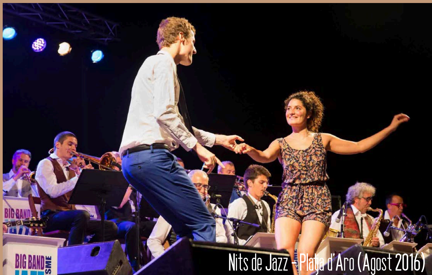
Nits de Jazz - Platja d'Aro (Agost 2016)