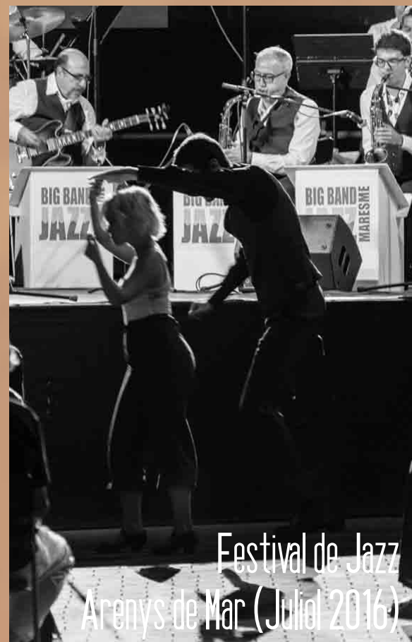
Festival de Jazz - Arenys de Mar (Juliol 2016)