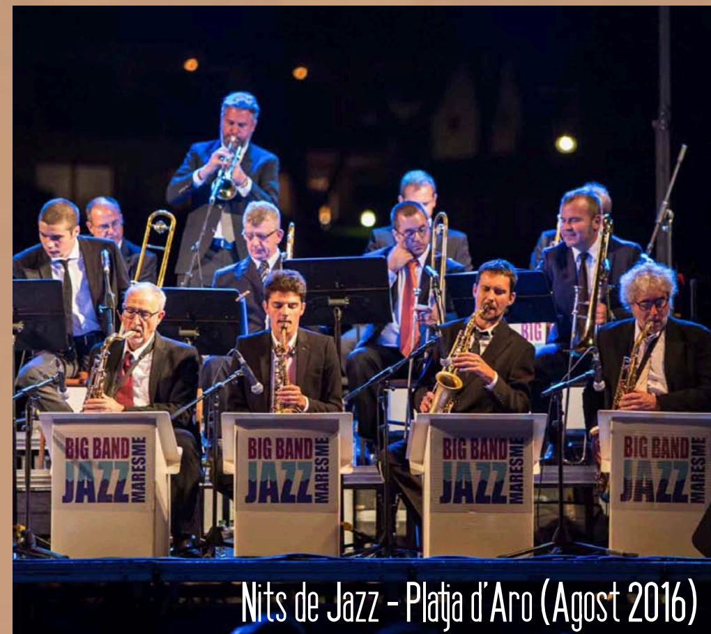
Nits de Jazz - Platja d'Aro (Agost 2016)